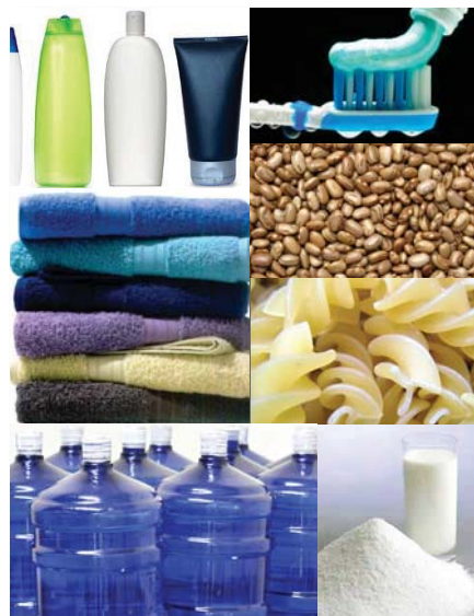
Água, alimentos não perecíveis, material de higiene pessoal e limpeza, fraldas e leite em pó são bem-vindos

A campanha continua em vigor e todo tipo de material é bem-vindo. Roupas limpas,